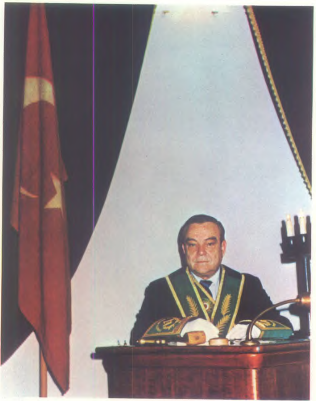
P.S. B. s. ŐEKR OKTEN 1981