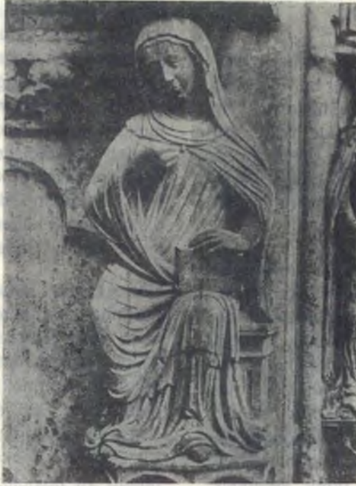
No. 4 — Chartres kilisesinde kapalı kitaplı kadın

Notre Dame kilisesinin bizi ilgilendiren kabartmasında, koltukta oturan kadın sağ eli ile iki kitap tutmaktadır. Bu kitapların biri açık diğeri ise kapalı ve bir kayış ile sıkı sıkıya bağlıdır. Bu kabartma ile birlikte Fransa'da 1260 yılları civarında inşası kısmen tamamlanan Chartres katedralinde bulunan 4 heykeli de tetkik etmekte yarar vardır. Bunlar da elinde kitap tutan bir kadını canlandırmaktadırlar. Birinci heykelde (Resim : 4) kitap