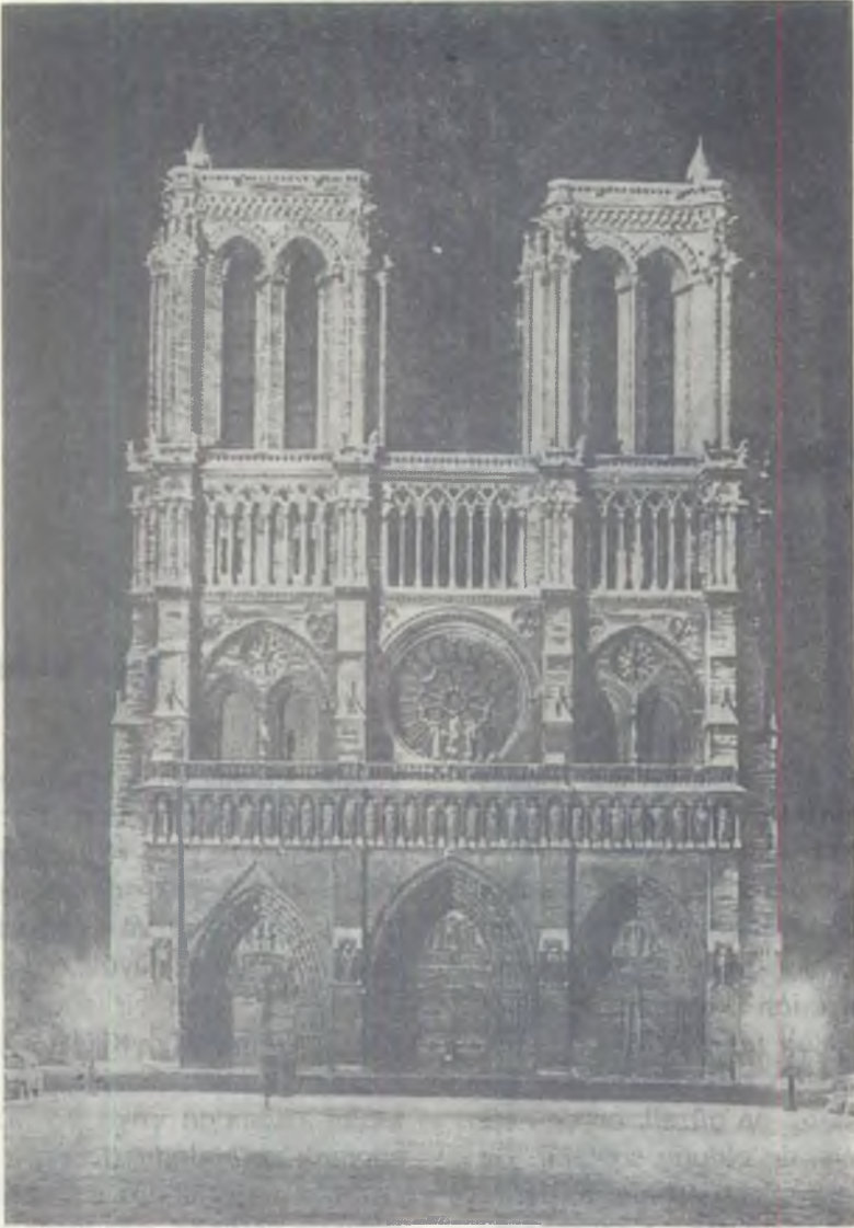
No. 1 — Notre Dame kilisesinin dıştan görünüşü