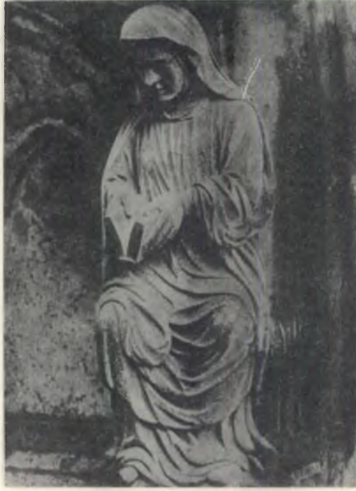
No. 5 — Chartres kilisesinde kapalı kitabı açmaya çalışan kadın

kapalıdır ve kadın içine dönük durumdadır. İkinci heykelde (Resim : 5) kadın kitabı açmaya gayret etmektedir, kitap kısmen açıktır ve bunun güç bir işlem olduğu hissedilmektedir. Üçüncü heykelde (Resim : 6) kadın açmayı başardığı kitabı okumakta, kitabın içine adeta dalmış gibidir. Dördüncü heykel ise (Resim : 7) kadını vecd halinde göstermektedir. Bu 4 heykel değerlendirildiği zaman, kitabın içine girebilmenin, kitabın özüne nüfus edebilmenin özel bir