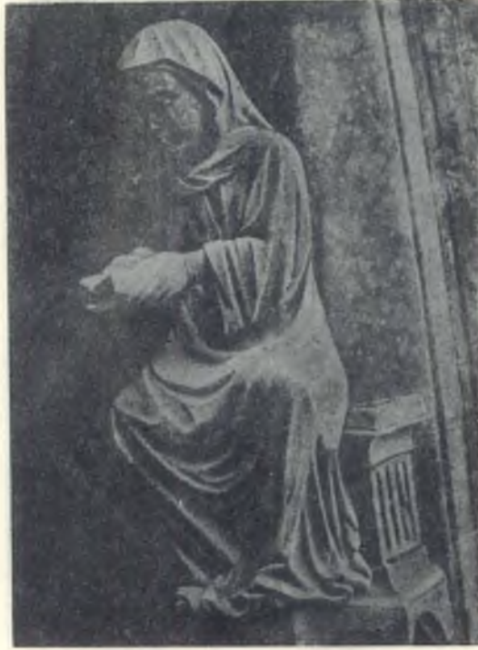
No. 6 — Chartres kilisesinde kapalı kitabı okuyan kadın

bu kitabın Mukaddes Kitap olacağı herkes tarafından benimsenen bir gerçektir.