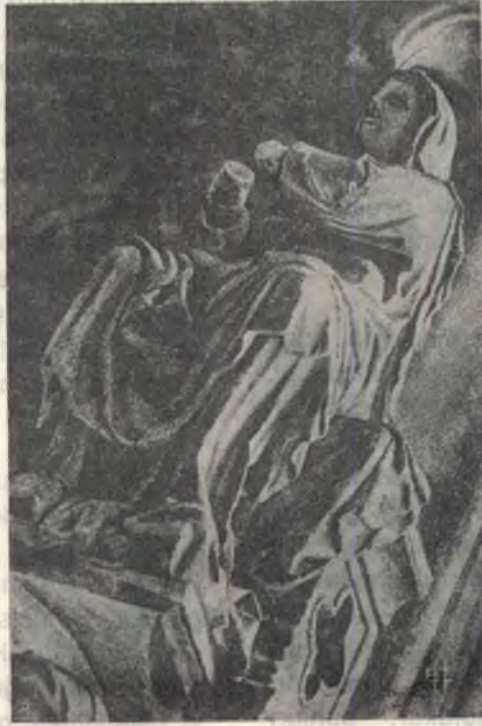
No. 7 — Chartres kilisesinde kapalı kitabı okuyup vedde gelen kadın

bulunmaktadır, zahir ve batın te'lif edilmiştir.