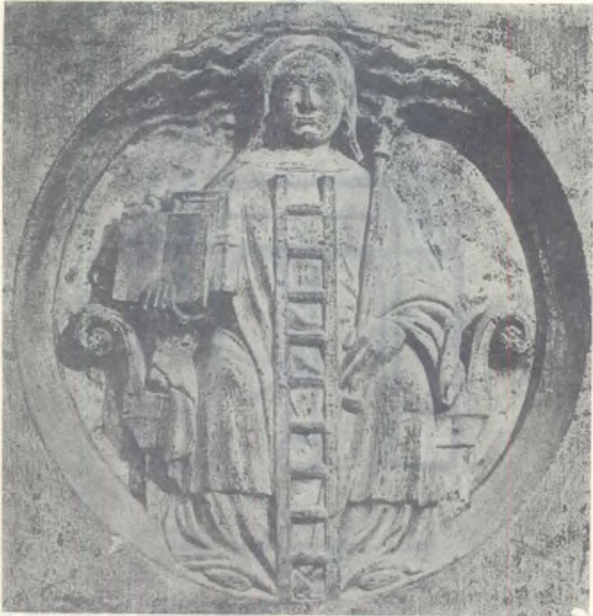
No. 3 — Giriş kapıda bulunan kabartma

ayıran ortaçağ taşyontarları büyük bir gayret ve itina ile inşa ettikleri pek çok heykel ve kabartmalarla süsledikleri Notre Dame kilisesinin kapısına, kiliseye her girenin muhakkak göreceği bir yere, o devre için özel bir anlam ve değer taşımayan felsefeyi canlandırmak için emek sarf edeceklerini benim-