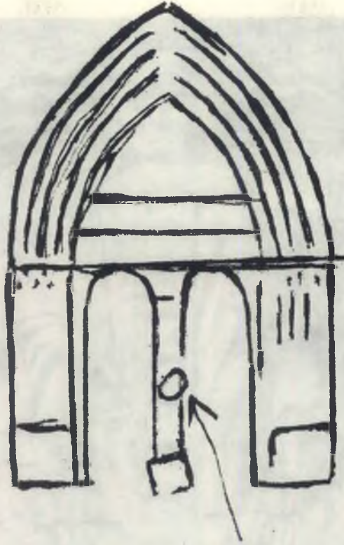
No. 2 — Ana giriş kapının krokisi

leyen ziyaretçi bu kabartmayı görmeden asla geçemez. Kabartma, koltukta oturan, kadın olması kuvvetle muhtemel olan bir kişiyi resim etmektedir. Kadın, sol elinde, ilginç bir şekilde bir asa tutmakta, sağ elinde ise biri kapalı diğeri açık iki kitap taşımaktadır. Kapalı kitabın bir kayışla çevrelenmiş olması ayrıca dikkati çekmektedir. Kadının saçlarının üstünde bir dalgalanmayı andıran kıvrımlar vardır. Kadının iki bacağı ara-