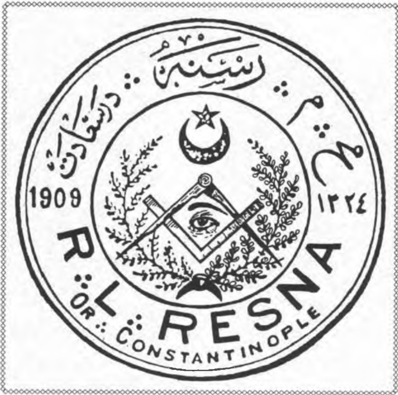
Resne Locasi'nın Osmanlı Dönemi'ndeki Mührü