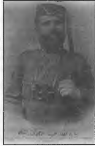
Resneli Niyazi Bey'in dağa çıkışı

Rumeli'ndeki ordunun dağa çıkışı İngiltere, Fransa, Rusya ve öteki Avrupa devletlerinde geniş yankılar uyandırdı. Padişaha çektiği telgrafla ayaklanmayı Meşrutiyet ilan edilinceye kadar sürdüreceğini bildirdi. Ohri Kolağası Eyüp Sabri Efendi (5) ile Kurmay Binbaşı Enver Bey, Tikveş (6) dolaylarında askerleriyle birlikte dağa çıktığını bildirdi. Ohri-Resne-Manastır-Selanik-Kosova yörelerinde İttihat ve Terakki mensupları dağa çıkmış ve hükümete alınacak önlemler üzerine bildiriler yaymaya başlamıştı.