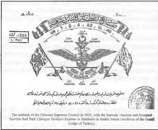
1910 yılında Osmanlı Yüksek Şurası'nın amblemi. Metin: "İskoçya Tarikat-ı Kadim ve Makbule"

içeren her çeşit cemiyeti, İslâm dışı bir kültürden de gelse, tarikât olarak nitelendirirlerdi. İstanbul'da, bu konuda şaşılacak bir örnek yaşanmıştır: 18. yüzyılın ilk on yılında, "Üzüm Nizamı" ( Ordre de la Grappe ) adında bir Fransız Bakik/içki cemiyeti Osmanlı hükümeti tarafından bir derviş tarikatı olarak kabul edilmiştir (3) . Daha sonra, masonik ritüeller Türkçeye çevrilince, "Eski ve Kabul Edilmiş İskoç Riti" ifadesinde, "rit" sözcüğünün yerini "tarikât" sözcüğü almıştır ( İskoçya Tarikat-ı Kadime Makbule ). Burada tarikât sözcüğü Sûfi Tarikini ( yolunu ) ima etmektedir. Açıktır ki, Müslüman Masonların zihninde "rit" sözcüğünün karşılığı " tarikât ", bir başka deyişle, Sûfi / Mistik Tariki idi.