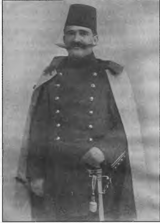
Resneli Niyazi Bey

binlerce kartpostal basılıp piyasaya sürüldü; ortada Padişah II. Abdülhamit, solunda Niyazi Bey, sağında ise Enver Bey. Kartpostalda bir resim daha vardı: Niyazi Bey'in evcilleştirdiği ve yanında İstanbul'a getirdiği geyiği.... "Geyikli Kartpostal"lar Osmanlı Devleti'nde satış rekorları kıracaktı. Niyazi Bey'in ismi bir savaş gemisine verildi. Ama Niyazi Bey kazandığı bu üne karşın, İttihat ve Terakki içinde önemli bir yere gelemedi. İttihatçılar arasında büyük bir yarış başlıyordu, herkes devlet değirmeninin bir ucundan tutmak istedi. Tutanların çoğu Niyazi Bey dağlarda iken sıcak yataklarında uyuyanlardı.