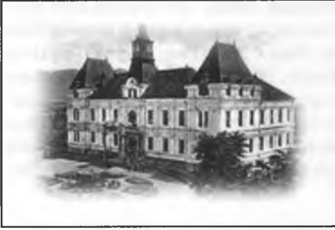
Resneli Niyazi Beyin Sarayı

risi kendi elinden çıkmıştır. Paris'e giden bir kartpostalın saray resmi üzerine, kendi sarayını çizmiştir. Sarayın inşaatına 1904 yılında başlanmış, 1912 yılında tamamlanmıştır. Bu yapı hiçbir Avrupa veya Osmanlı mimarî tarzına göre inşa edilmemiştir. Bina iki katlı olup bir de bodrum katı bulunmaktadır. 5600 m alanı kaplayan gerekli malzemeler