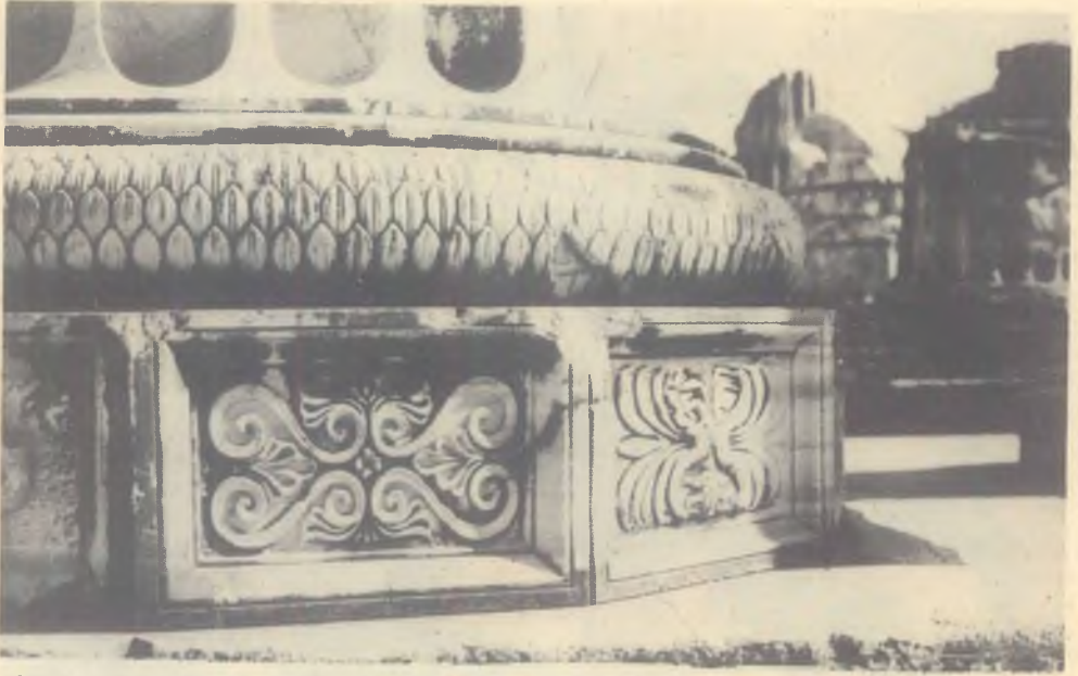
DİDİMA (Apollo mabedinden)