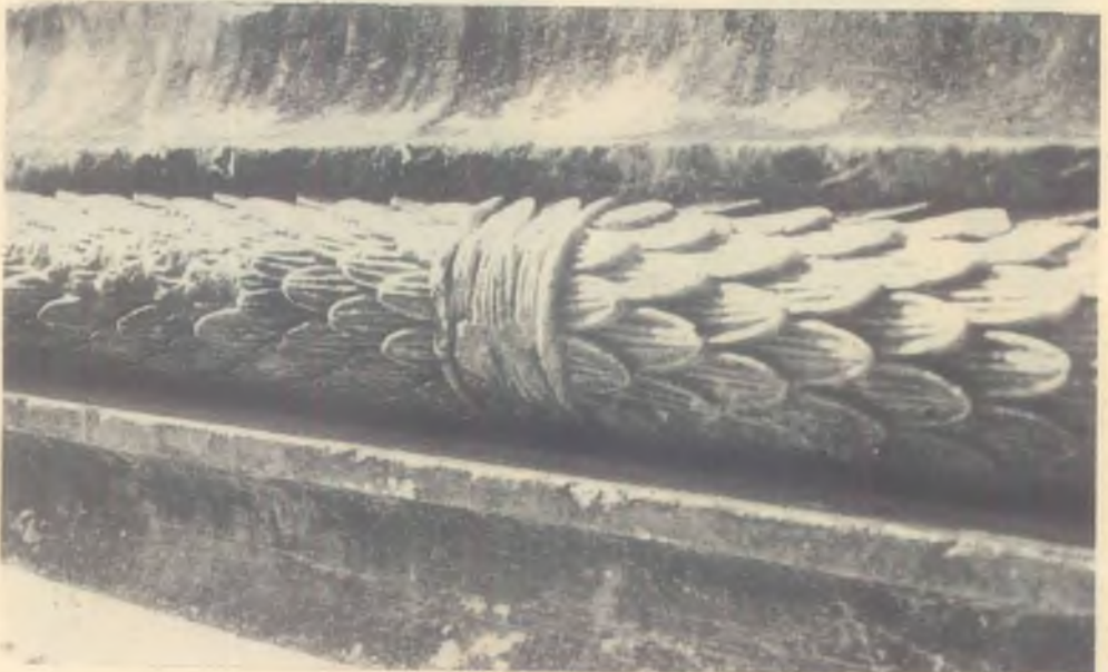
DİDİMA (Apollo mabedinden)