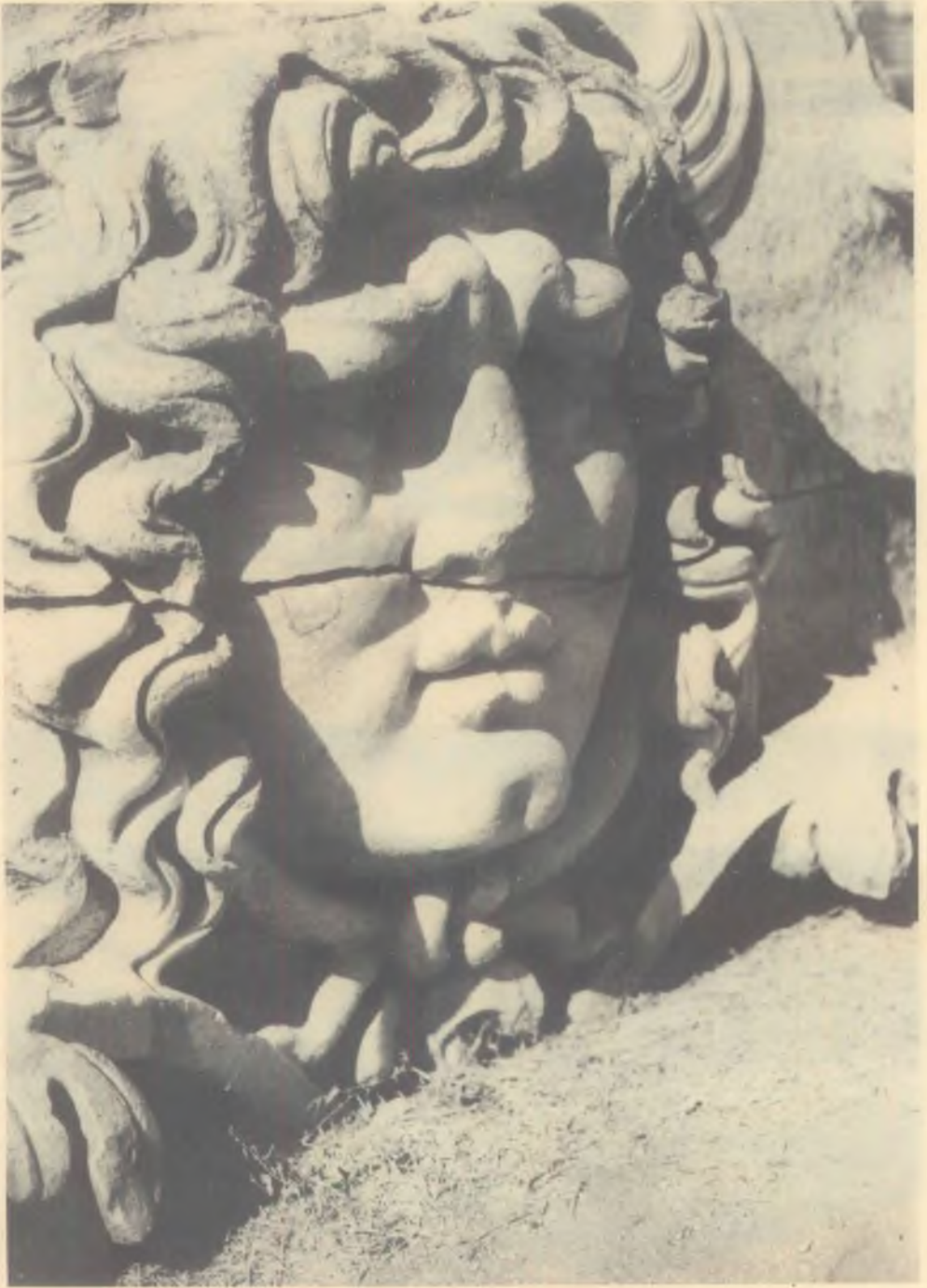
DİDİMA (Meduza başı)