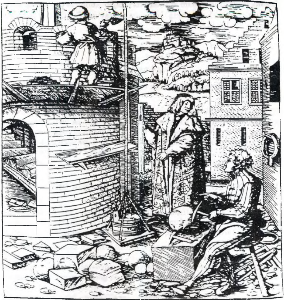
Beyaz Kral (I. Maximilien) ve Üstat Mason

Fransa'ya özgü bir örgütlenme tarzı olan Compagnonage'ın 12. yüzyılda katedral inşaatları ile başladığı tahmin edilmektedir. Katedrallerin kayıt defterlerinden, Refik Jean de Chelles'in Notre-Dame de Paris ve Refik Robert de Luzarches'in Amiens katedrallerinin inşaatlarını 1297'de, 1212'de Refik Robert de Coucy'nin başlattığı Reims Katedralinin inşaatına Refik Jean d'Orbois'nın devam ettiği, 1276 yılında, Strasbourg Katedrali inşaatında, Habsbourg Hanedanından İmparator 1. Rudolf'un taş yontan ustalara ilk muafiyet lisanslarını (franchi-