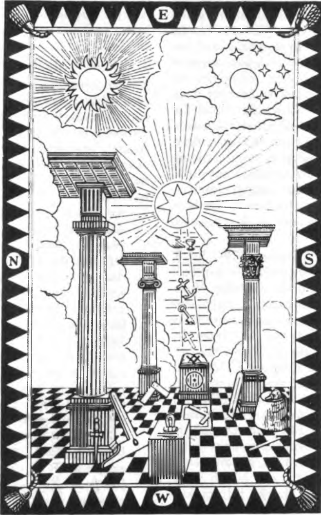
Şekil 6. Birinci Derece Çalışma Tablosu'nda Merdiven ve Anahtar Sembolleri (Ref. 5)

geler. Anubis, kocası ve erkek kardeşi Osiris'in cesedini aramaya çıkan İsis Tanrıçası'nın da arkadaşı idi. Daha sonraki bir efsaneye göre, bu yıldız, Osiris'in öğ-