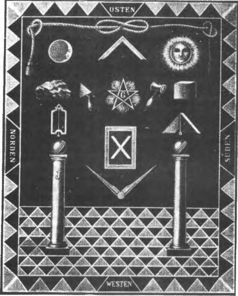
Şekil 1. Bugün (1997) Alman Locaları'nda Kullanılan Çırak Çalışma Tablosu (Ref. 4)

manâsı daha çok İkinci Derece'de verilir ve daha çok İkinci Nâzır'ın görev mücevheri olarak kullanılır. Ayrıca, Şâkul'a Üstâd-ı