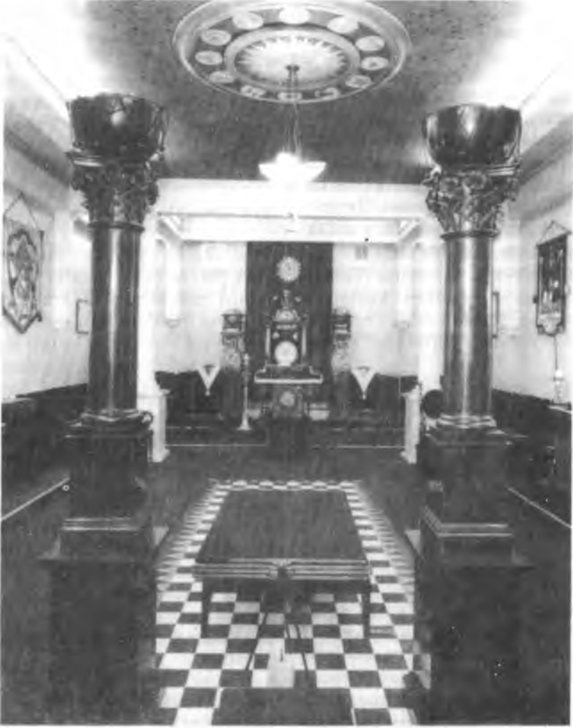
Şekil 2. İngiltere'de 41 Numaralı Kral Cumberland Locası'nın İç Görünüşü, 1805 (Ref. 4)

gereken 7 özelliği ( iman, ümit, şefkât, tedbir, iffet ve adâlet ) simgeler.