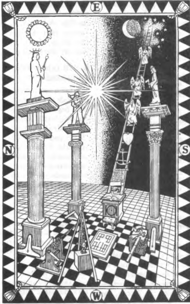
Şekil 5. Birinci Derece Çalışma Tablosu'nda Merdiven Sembolleri (Ref. 5)

ründeki iyilik ve kötülük, şeytan ve iyilik meleği, gece ve gündüz, sevgi ve nefret, hürriyet ve istibdâd gibi hayattaki tezatları simgeler.