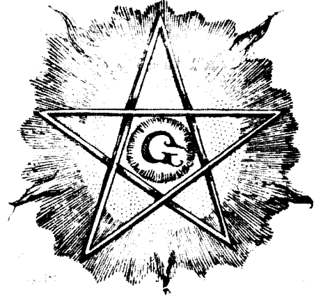
Şekil 7. Alev Saçan Yıldızlar (Soldaki yıldızın içine bir de, Osiris'in gözü eklenmiştir.) (Ref. 4)