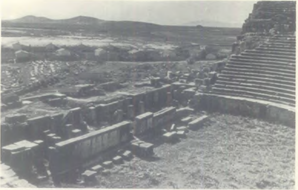
MİLE — SAHNE