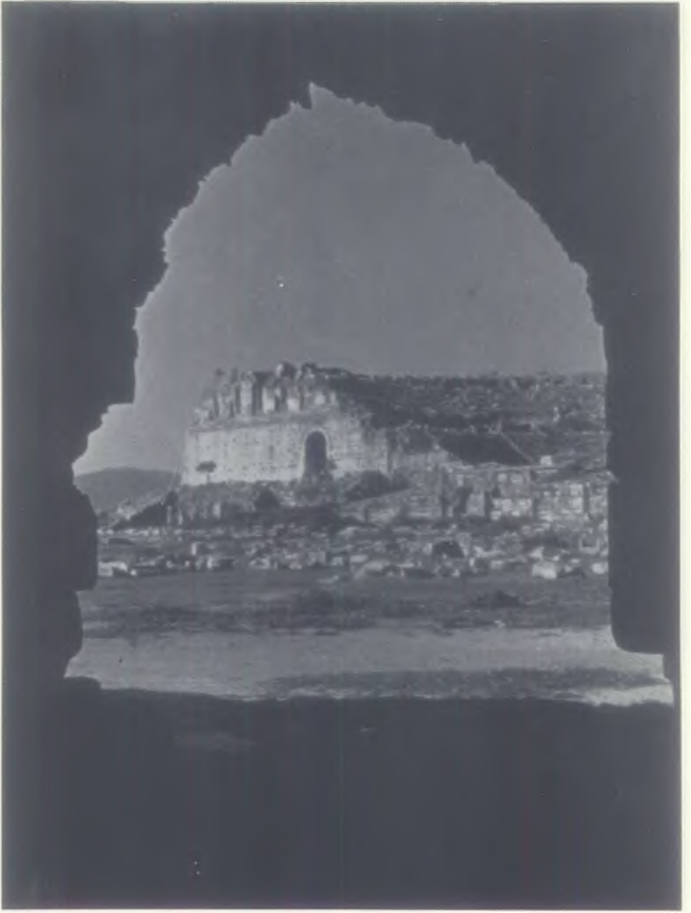
MILE — AMFI