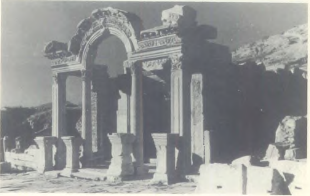
EFES YENİ KIBİMDAN