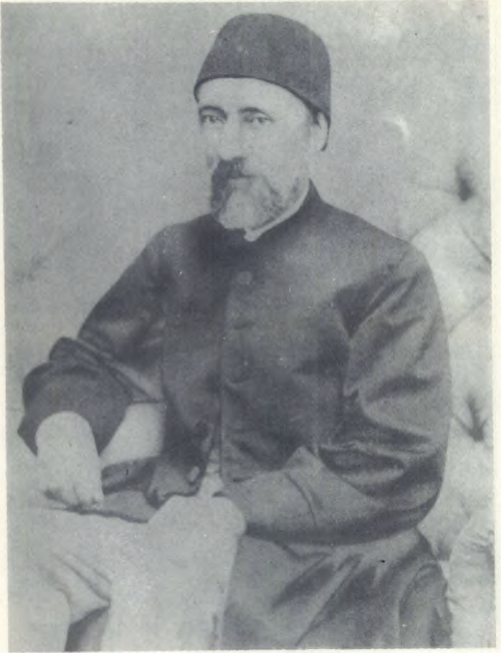
MEHMET EMİN ALI PAŞA B.: