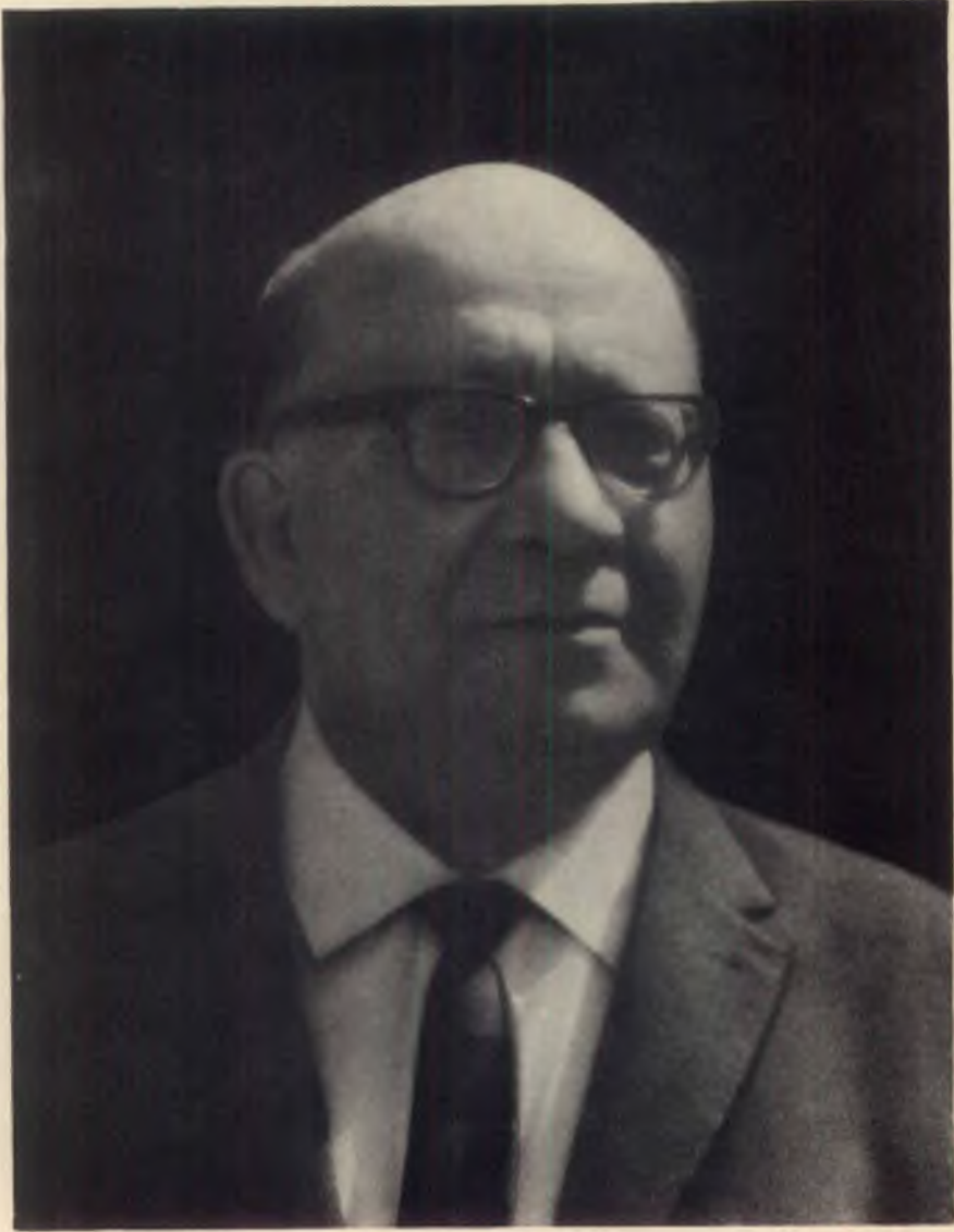
BÜYÜK ÜSTAT HAYRULLAH ÖRS B .: