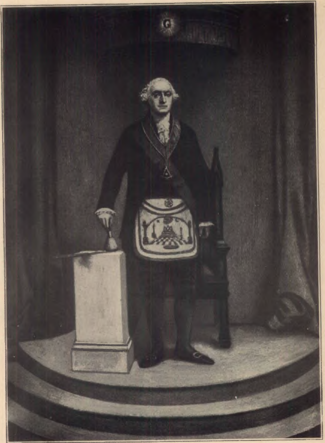
GEORGE WASHINGTON B .: